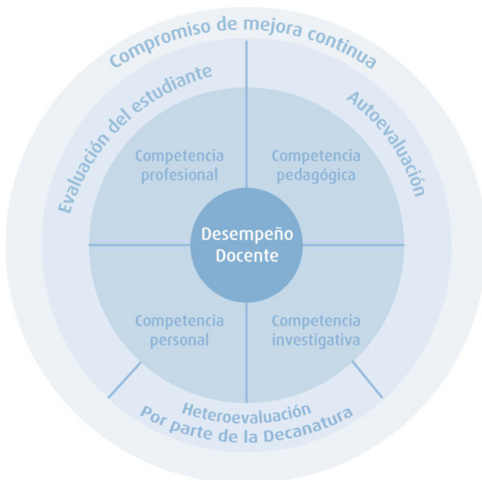
Modelo de evaluación profesoral UNICAFAM